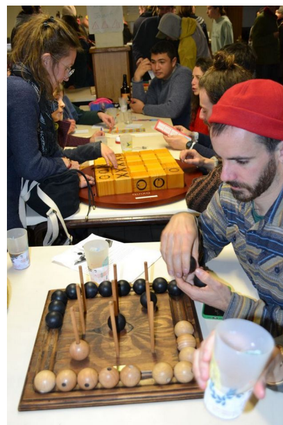
Jeux prêtés par la Médiathèque départementale de Lozère